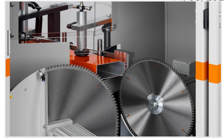
端面角切割机 AKS V-550