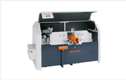
AKS 134/64 + 选装配件