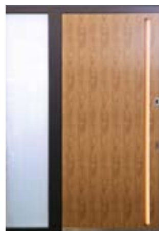
Exkluzív bejárati ajtó