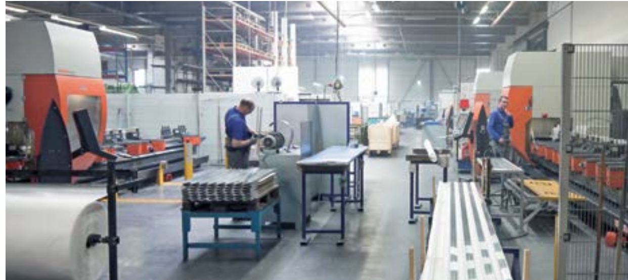
Proizvodna hala tvrtke PFEIFFER: učinkovitost osigurava tvrtka elumatec.