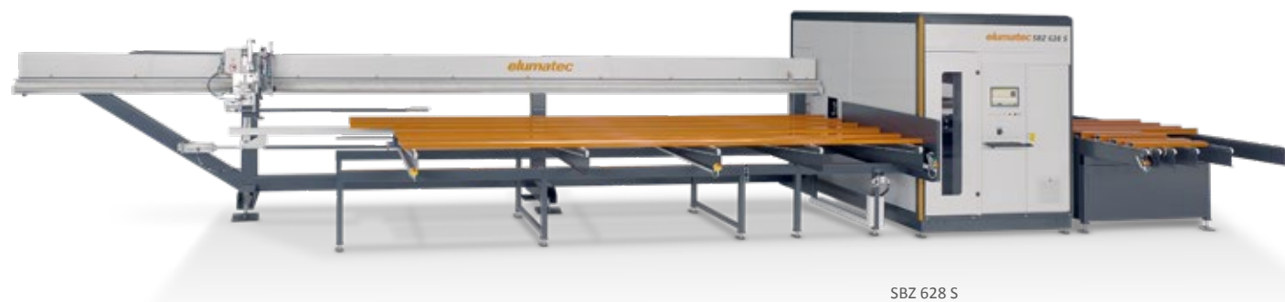
SBZ 628 S