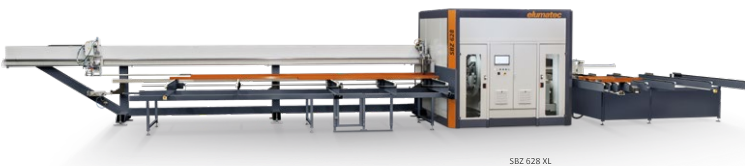
SBZ 628 XL