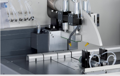
Otomatik Testere SAS 142/44