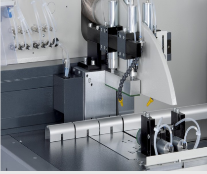
Otomatik Testere SAS 142/44