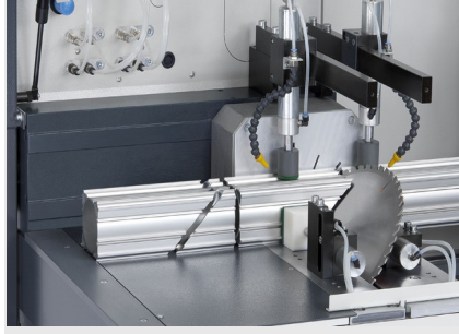
Otomatik Testere SAS 142/43