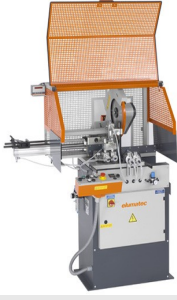
Otomatik Testere SA 73/36