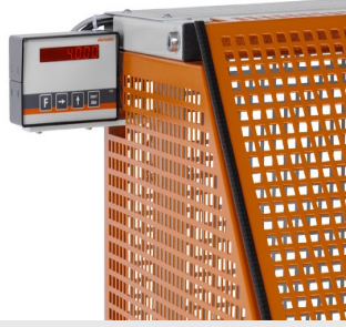
Otomatik Testere SA 73/36