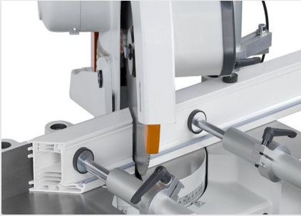
Tek Başlı Testere MGS 73/33