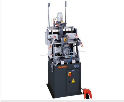
Iki Motorlu Kopya Freze KF 78/23