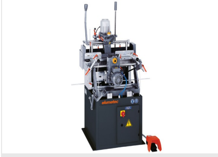
Iki Motorlu Kopya Freze KF 78/23