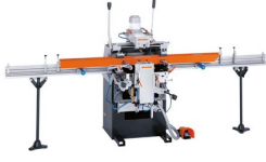
Üç Motorlu Kopya Freze KF 178/10