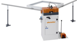
Köşe bağlantı presi EP 120