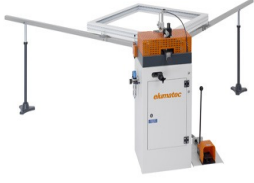
Köşe bağlantı presisi EP 120