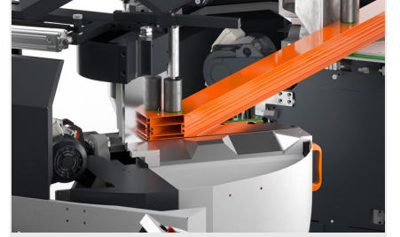
Çift Başlı Testere DG 104