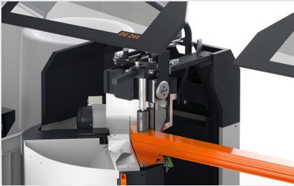
Çift Başlı Testere DG 104