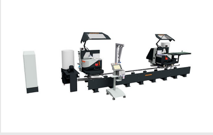
Çift Başlı Testere DG 104 + E590