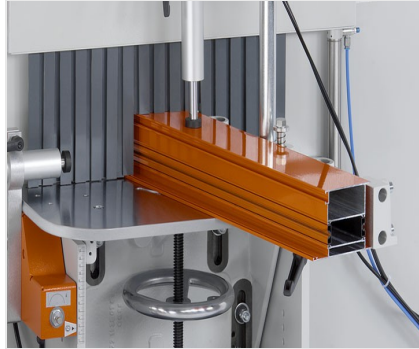
Orta Kayıt Kerme Makinesi AF 223/01