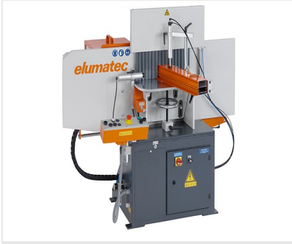
Orta Kayıt Kerme Makinesi AF 223/01