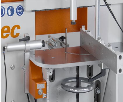
Orta Kayıt Kerme Makinesi AF 223/01