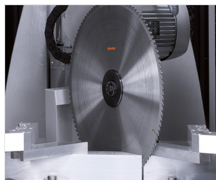
Обработывающий центр SBZ 631