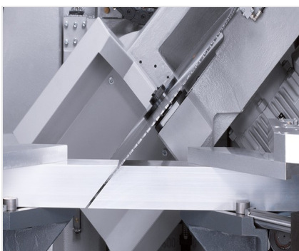
Обработывающий центр SBZ 631