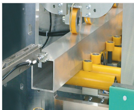
Обработывающий центр SBZ 631