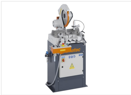
Усорезная пила MGS 73/33