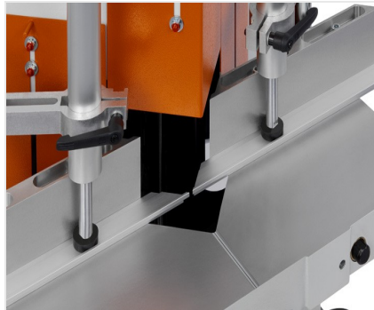
Пила для клиновых и торцевых вырезов KS 101/30