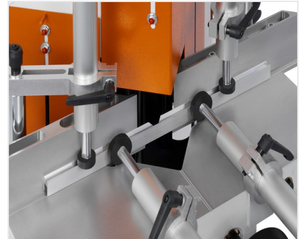
Пила для клиновых и торцевых вырезов KS 101/30