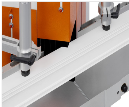
Пила для клиновых и торцевых вырезов KS 101/30