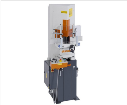
Пила для клиновых и торцевых вырезов KS 101/30