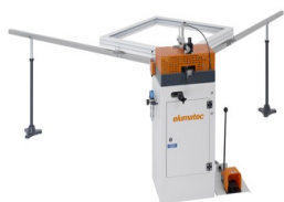
Пресс для стыковки углов EP 120