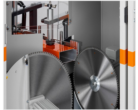
Пила для торцевой обработки профиля AKS V-550