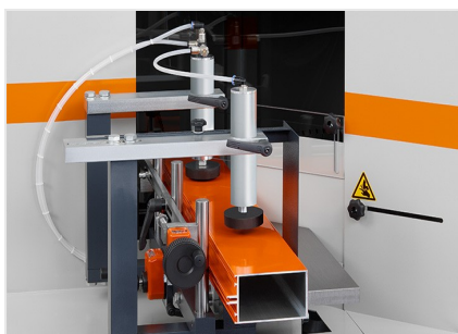
Пила для торцевой обработки профиля AKS V-550