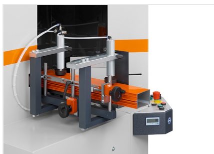
Пила для торцевой обработки профиля AKS V-550