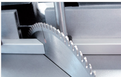
Máquina de corte auxiliar TS 161/21