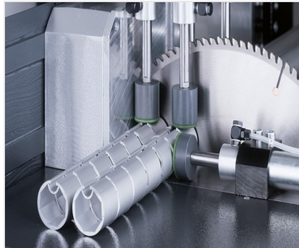
Máquina de corte automática SA 142/37