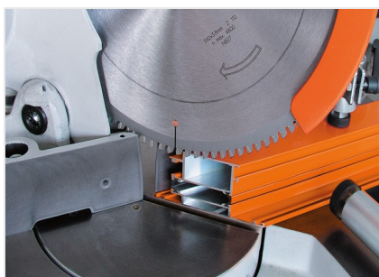
Máquina de corte angular MGS 73/33