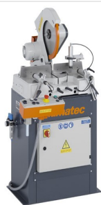
Máquina de corte angular MGS 73/33