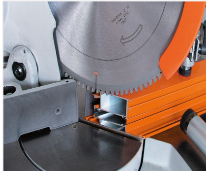
Máquina de corte angular MGS 73/33