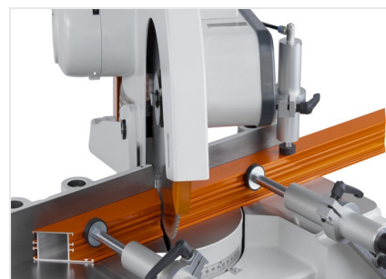
Máquina de corte angular MGS 73/33