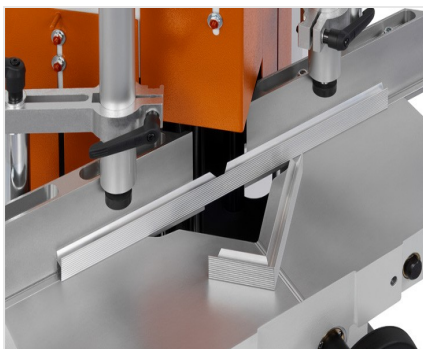
Máquina de corte em V KS 101/30