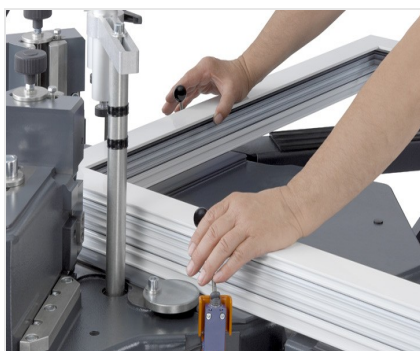
Máquina de cravar cantos EP 124/20