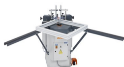
Máquina de cravar cantos EP 124