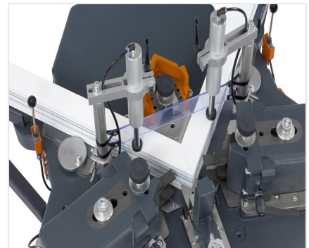
Máquina de cravar cantos EP 124