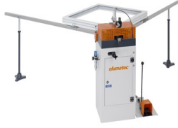
Máquina de cravar cantos EP 120