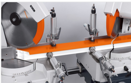
Máquina de corte de duas cabeças angulares DG 79