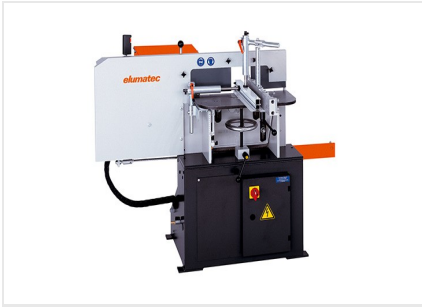
Fresa de malhetar AF 222/02