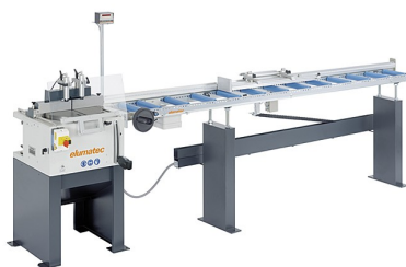
Piła stołowa TS 161/21 + MMS 200