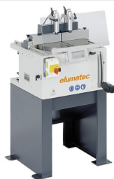
Piła stołowa TS 161/21