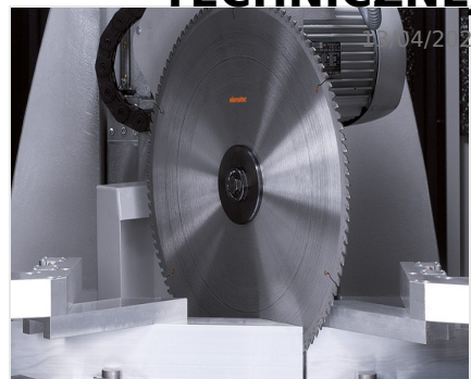
Centrum obróbcze profili SBZ 631