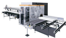
Centrum obróbcze profili SBZ 631