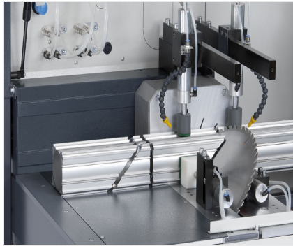
Automat do cięcia SAS 142/43