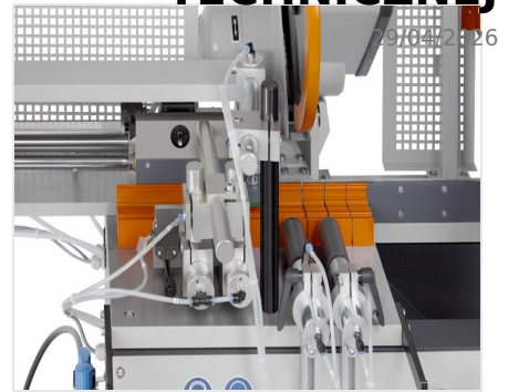
Automat do cięcia SA 73/36