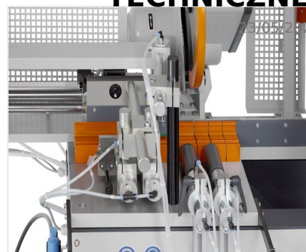
Automat do cięcia SA 73/36