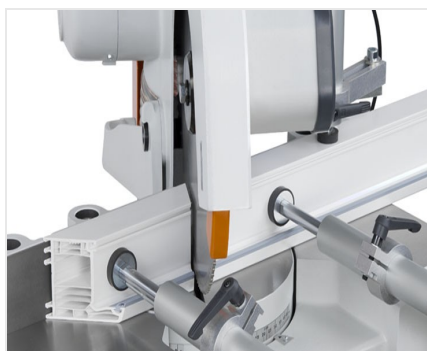
Piła obrotowa MGS 73/33