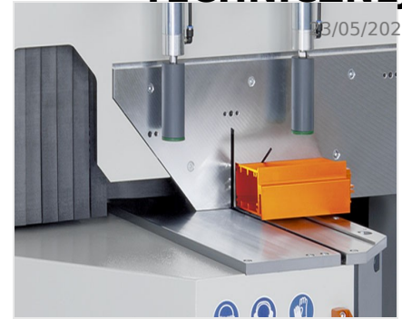
Piła obrotowa MGS 105