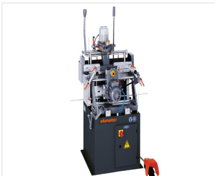
Dwuwrzecionowa frezarko-kopiarka KF 78/23