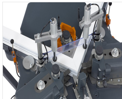
Zaciskarka do naroży EP 124