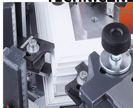
Zaciskarka do naroży EP 124