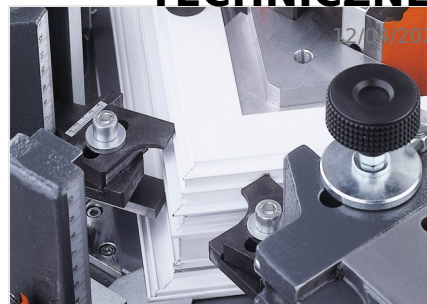
Zaciskarka do naroży EP 124