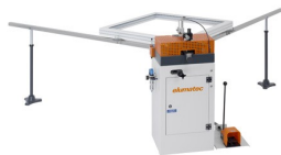
Zaciskarka do naroży EP 120