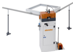
Zaciskarka do naroży EP 120