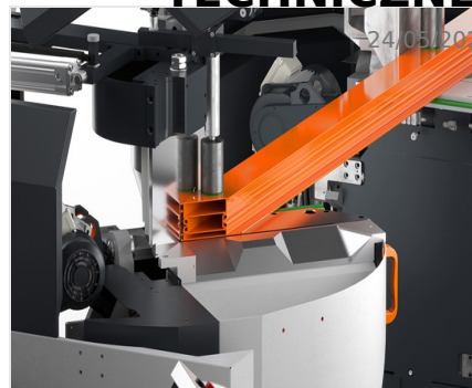
Piła dwugłowicowa DG 104