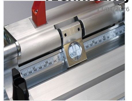
System pomiarowy AMS 200