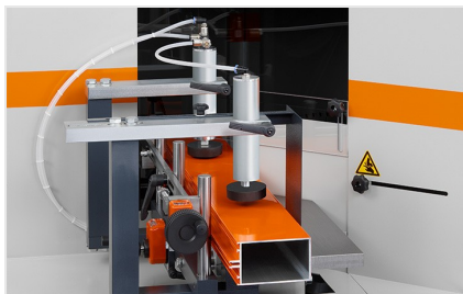
Piły do wycięć klinowych AKS V-550