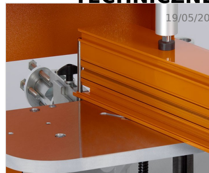
Frezarka do słupków AF 223/01