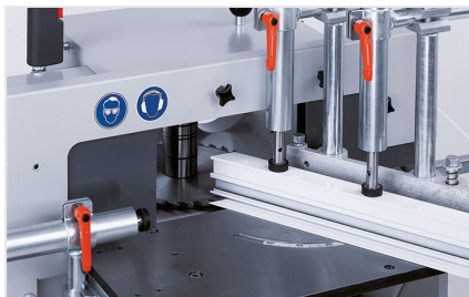
Frezarka do słupków AF 222/02