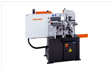
Frezarka do słupków AF 222/02