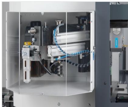
SBZ 140 Profielbewerkingscentrum