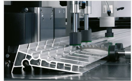
Zaagautomaat SAS 142/44