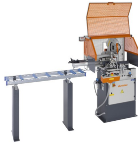
Zaagautomaat SA 73/36