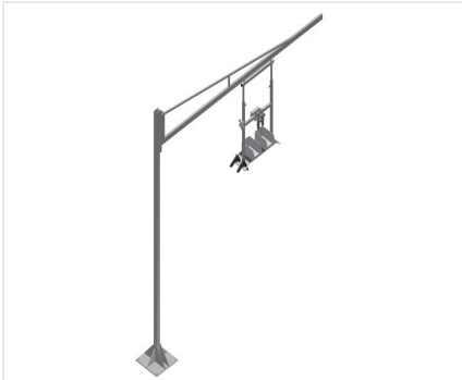
Gereedschaphouder G 3000 + stalen kolom S 3000