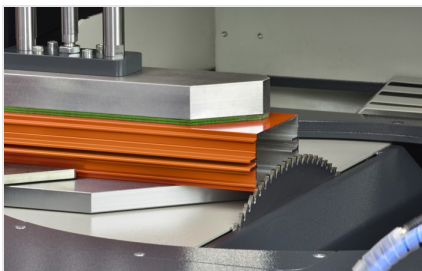
Centro di ritaglio SBZ 616/02