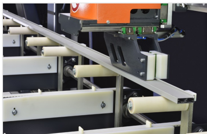
Centro di ritaglio SBZ 616/02