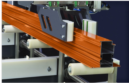
Centro di ritaglio SBZ 616/02