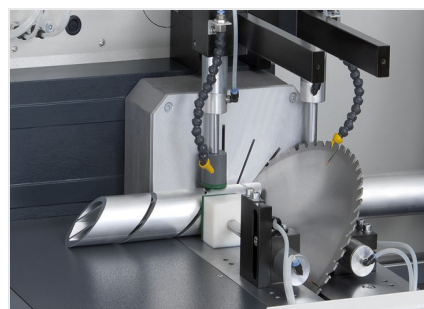
Troncatrice automatica SAS 142/43