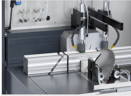
Troncatrice automatica SAS 142/43