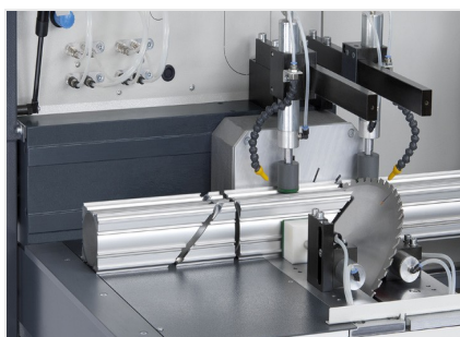
Troncatrice automatica SAS 142/43