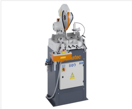
Troncatrice per tagli obliqui MGS 73/33