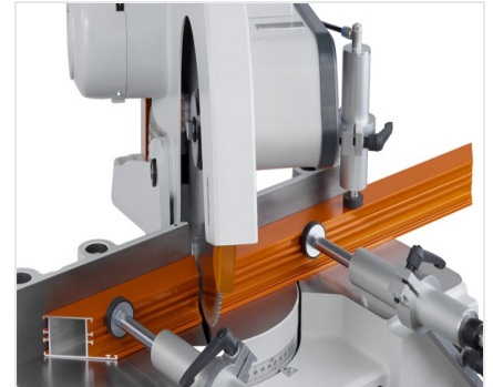
Troncatrice per tagli obliqui MGS 73/33